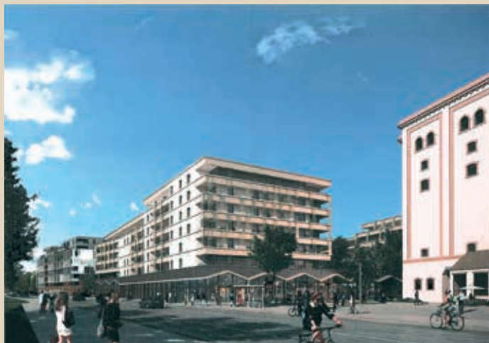
Axonométrie sud est depuis la route de Bischwiller

Au quartier Fischer, les résidents pourront bénéficier de commerces, d'équipements publics, de points de restauration, d'espaces verts... En somme d'un quartier vivant dont le patrimoine architectural sera préservé.