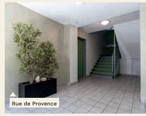
Rue de Provence

Nous espérons que ces embellissements vous plaisent et contribuent à l'amélioration de votre qualité de vie de locataire.