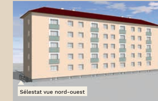
Sélestat vue nord-ouest

Les locataires des 20 appartements de la rue de Sélestat verront les premiers travaux démarrer en septembre et profiteront des mêmes prestations à l'issue du chantier, prévue fin avril 2019.