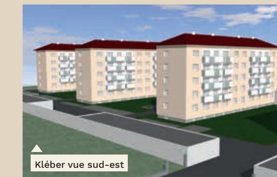
Kléber vue sud-est