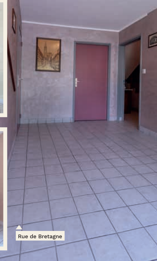
Rue de Bretagne