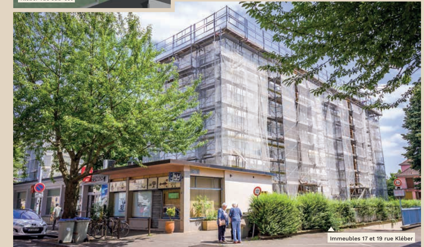
Immeubles 17 et 19 rue Kléber