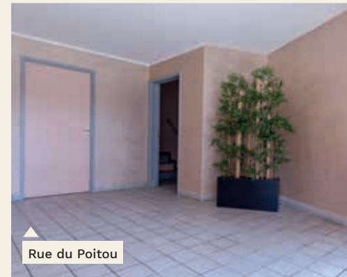
Rue du Poitou